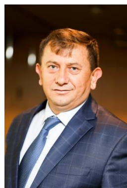
Selahattin Külçü Presidente de Central Union of Turkish Agricultural Credit Cooperatives, Turquía