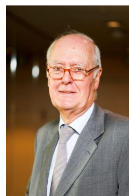
Etienne Pflimlin IRU-Tesorero Presidente Honorífico de Confédération Nationale du Crédit Mutuel, Francia