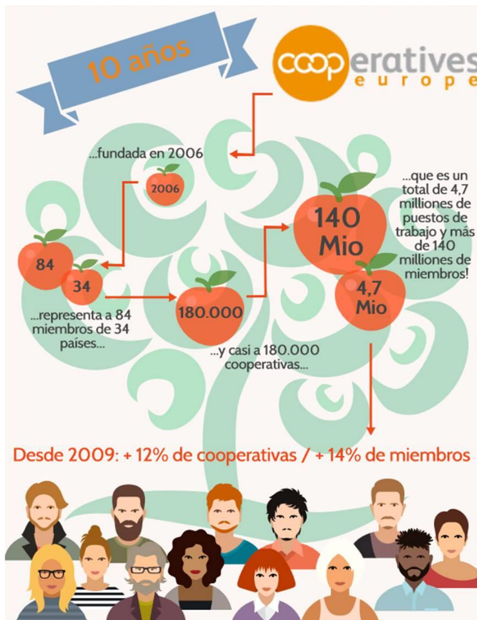
Cooperatives Europe en cifras