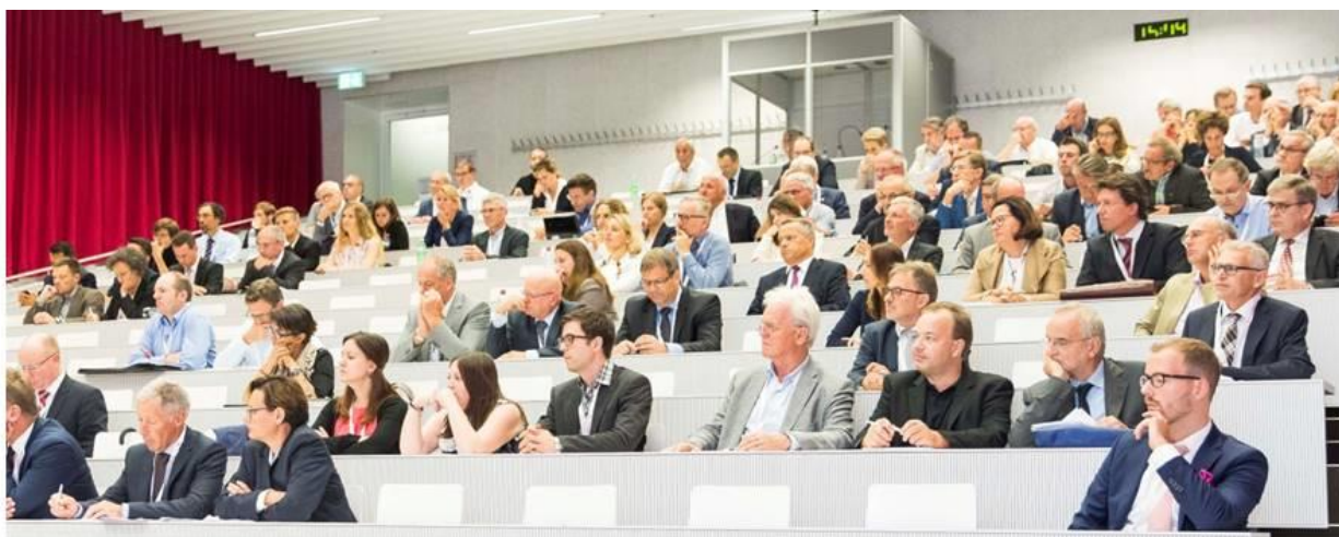
Asistentes al panel en el aula de la Universidad de Lucerna.

Del 14 al 16 de septiembre se realizó, en Lucerna, la 18. Reunión internacional de ciencias cooperativas. Este formato internacional tan exitoso no sólo convocó a más de 1000 participantes de todo el mundo, sino que dio también muchos impulsos nuevos al mundo cooperativo.