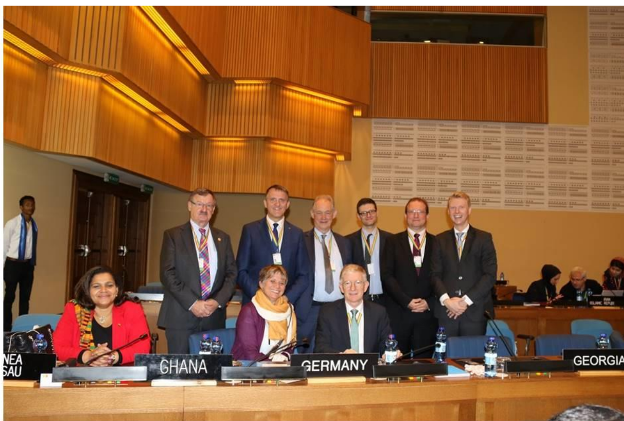
Representantes de la Deutsche Friedrich-Wilhelm-Raiffeisen-Gesellschaft, Deutsche Hermann-Schulze-Delitzsch-Gesellschaft y la comisión alemana de la UNESCO in situ en Etiopía

El día 30 de noviembre de 2016, el Comité del Patrimonio Mundial de la UNESCO, reunido en Addis Abeba/Etiopía decidió integrar la idea de la cooperativa a la "lista representativa". Bajo el título "La idea y la práctica de mancomunar intereses colectivos en cooperativas", la representación alemana de la UNESCO había presentado la nominación en el año 2015. La solicitud fue promovida entre otros por las dos asociaciones Deutsche Friedrich-Wilhelm-Raiffeisen-Gesellschaft y Deutsche Hermann-Schulze-Delitzsch-Gesellschaft.